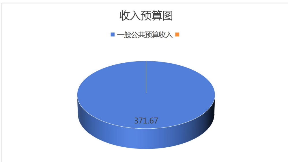
图 1. 收入预算图

本年上级补助收入 0 万元，占 0%； 本年附属单位上缴收入 0 万元，占 0%； 本年其他收入 0 万元，占 0%； 上年结转结余的一般公共预算收入 0 万元，占 0%； 上年结转结余的政府性基金预算收入 0 万元，占 0%； 上年结转结余的国有资本经营预算收入 0 万元，占 0%； 上年结转结余的财政专户管理资金 0 万元，占 0%； 上年结转结余的单位资金 0 万元，占 0%；