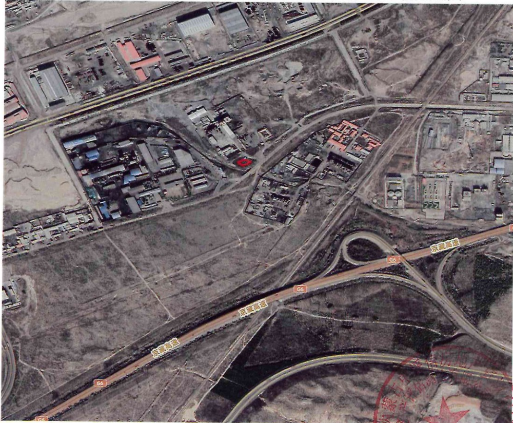
乌海市公共卫生间建设运营项目补植补造区域位置图